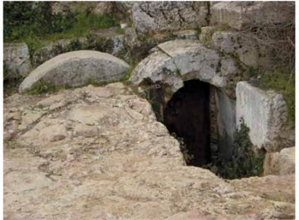
Felsengrab Jerusalem

In diesem Sinne wünsche ich Ihnen ein frohes und gesegnetes Osterfest, das uns Kraft und Mut für unser Leben gibt, so dass wir gestärkt von der Ostererfahrung wieder neu unseren Alltag meistern können.