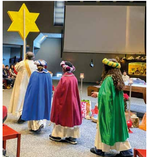
Dreikönige beim Einzug