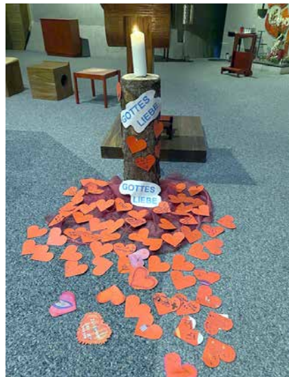
Herz – Gottes Liebe: Wie kann ich Gottes Liebe weitergeben?