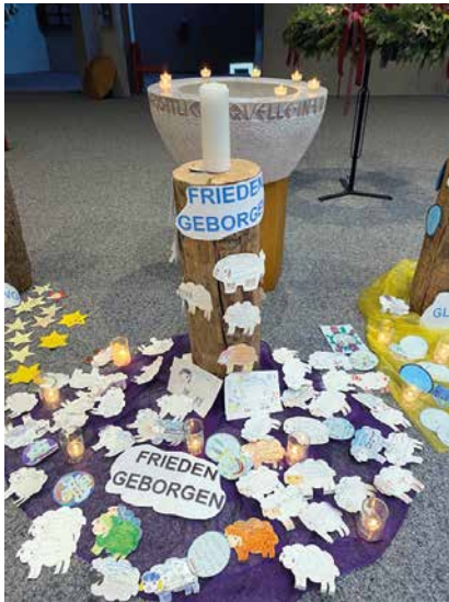
Schaf – Frieden: Wann und wo fühle ich mich geborgen?

In unseren vier Schulgottesdiensten im Advent wurde die Geschichte «Die vier Lichter des Hirten Simon» erzählt. Gleichzeitig gab es immer wieder ein anderes Symbol respektive ein anderes Thema, das die Schülerinnen und Schüler jeweils im Religionsunterricht behandelten: