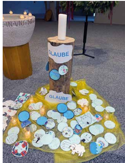
Kreis – Glaube: Wo kann ich Gottes Wirken spüren?