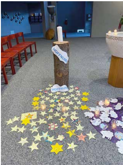
Stern – Hoffnung: Was gibt mir Hoffnung, wenn ich traurig bin?